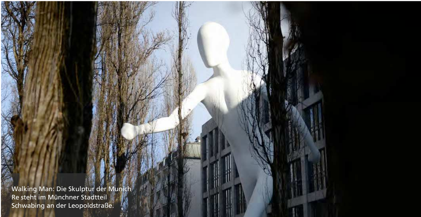
Walking Man: Die Skulptur der Munich Re steht im Münchner Stadtteil Schwabing an der Leopoldstraße.