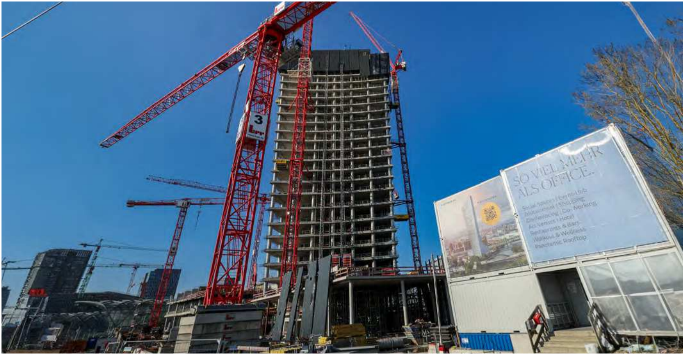
Hamburger Wolkenkratzer Elbtower: Das Objekt gehört zur Firmengruppe Signa des österreichischen Milliardärs Benko, die Baustelle ist seit Monaten verwaist.

Deutschland wäre damit nicht allein. Siehe Japan, siehe China. Ein Viertel der Länder, die die Weltwirtschaft bestimmen, stecken in Deflationsgefahr.